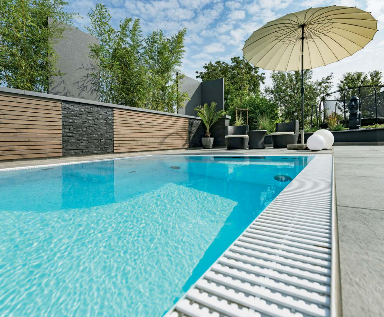
Der weiße Pool aus PP-Kunststoff mit Überlaufrinne wurde maßgeschneidert auf die Kundenwünsche angepasst – die Technik ist in einem Raum hinter der Natursteinwand untergebracht. Dieser Raum dient auch als Garage für die Überdachungselemente.